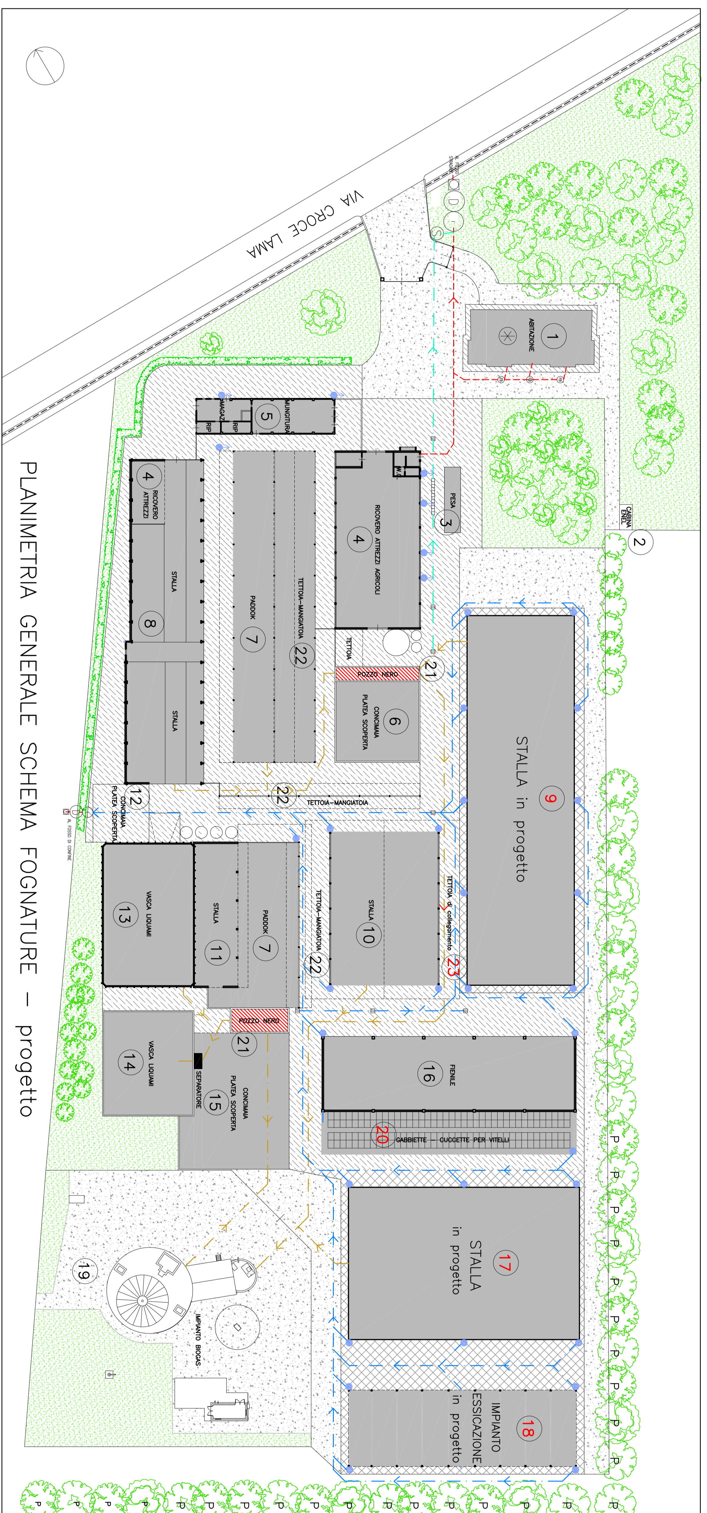
PLANIMETRIA GENERALE SCHEMA FOGNATURE – progetto